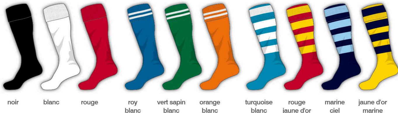
noir blanc rouge roy blanc vert sapin blanc orange blanc turquoise blanc rouge jaune d'or marine ciel jaune d'or marine