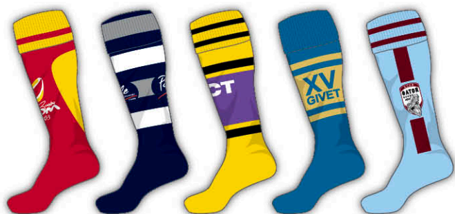
Exemples de réalisations